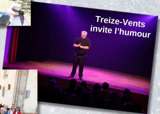
Treize-Vents invite l'humour