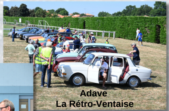
Adave La Rétro-Ventaise