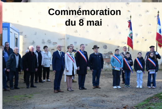
Commémoration du 8 mai