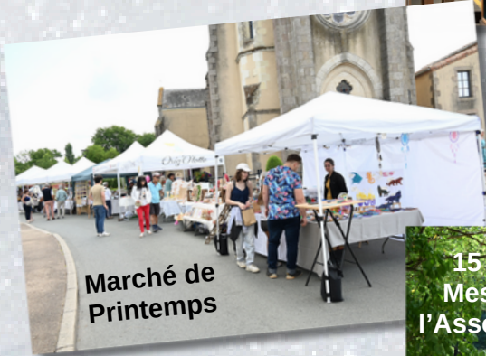
Marché de Printemps