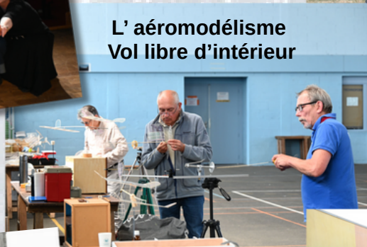
L' aéromodélisme Vol libre d'intérieur