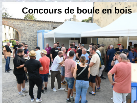
Concours de boule en bois