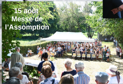
15 août Messe de l'Assomption