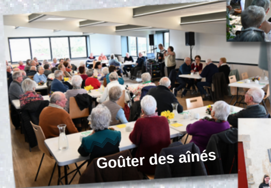
Goûter des aînés