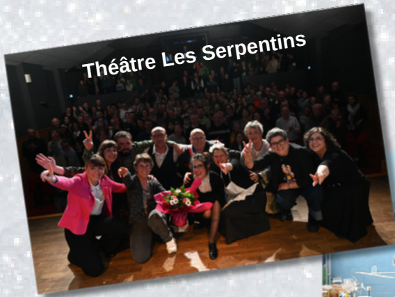
Théâtre Les Serpents