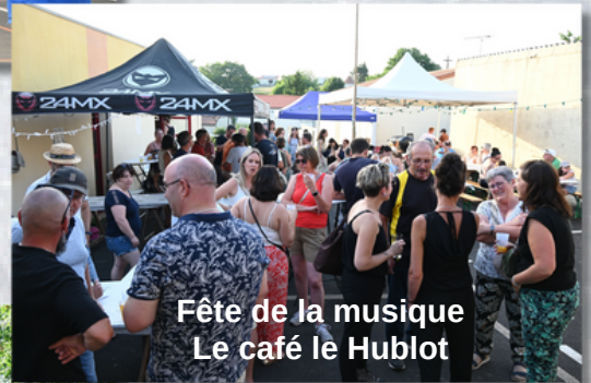
Fête de la musique Le café le Hublot